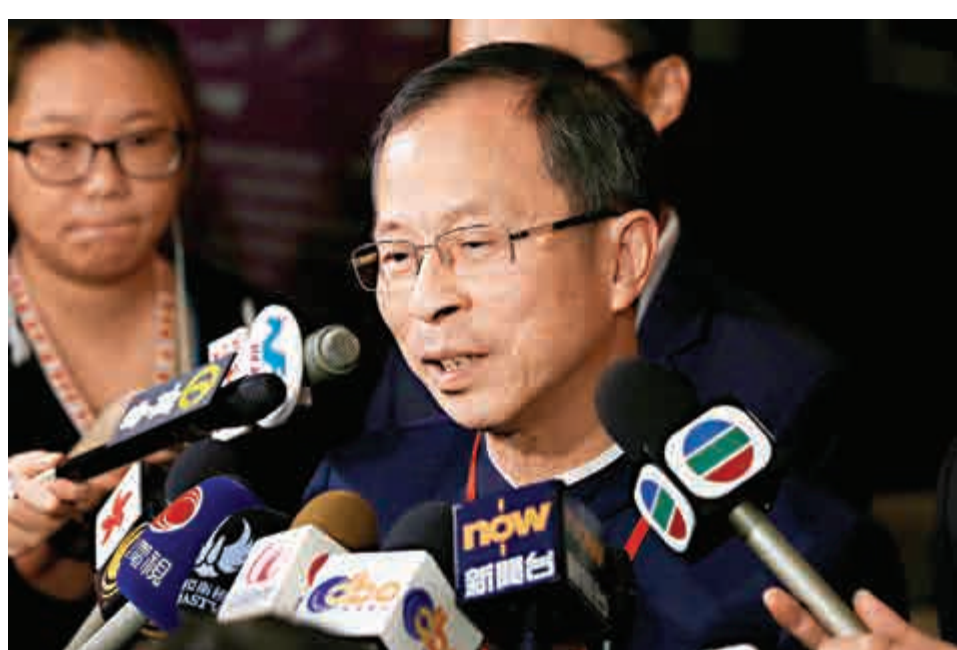
◀曾鈺成表明，希望立法會財委會十月復會，可以通過創科局撥款申請

論及自己早前曾表示聽聞內地地理香港事務官員和法律專家稱考慮有否需要修改基本法的事宜，曾鈺成回應稱，自己不是說內地要修改基本法，但就的確有考慮過「假如要修改基本法要如何做」。他補充，基本法於二十五年前頒布，現時國家、香港及中港關係都發生了不少變化，而且基本法規定的五十年不變，回歸後的時間已經過去了三分之一，所以「好自然要